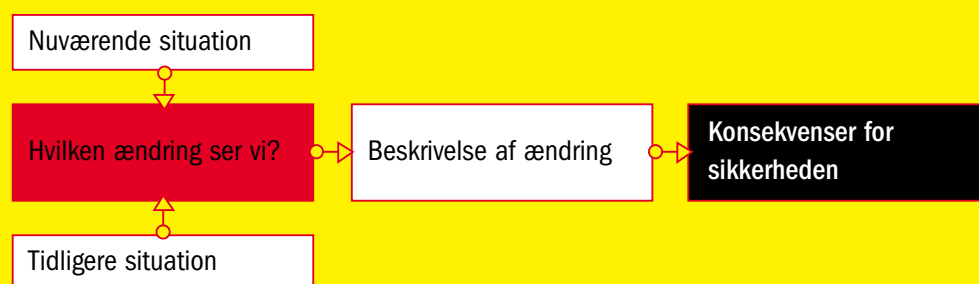
Figur 2. Konsekvensvurdering af ændringer.

Til slut afgøres det, om der er behov for tiltag over for de vurderede konsekvenser.